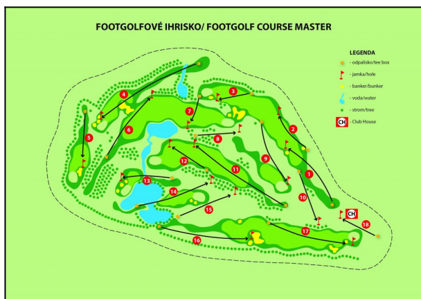
mapa ihriska MASTER

Golf park Rajec má od r. 2008 v prevádzke 9-jamkové golfové ihrisko, ktoré sa nachádza v krásnej Rajeckej doline. Poloha ihriska je ideálna: Žilina - diaľnica D1 (22 km), Pov. Bystrica - diaľnica D1 (19 km), Rajecké Teplice - kúpele (11 km). V sezóne 2017 sme u nás otvorili dve plnohodnotné 18-jamkové ihriská - jedno je samostatne určené len na FootGolf a druhé je umiestnené na súčasnom golfovom ihrisku.