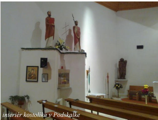
interiér kostolíka v Podskalka

značka, ktorá vedie do Lopusnej doliny. Aby ste prišli k druhému kostolíku s cyrilometodským patrocíniom, musíte z turistického chodníka odbočiť do mestskej časti Podskalka . Nachádza sa v severnej časti Svitu, kde vyrástla nová časť s rodinnými domami. Tu bol v r. 1992, vďaka obetavosti veriacich postavený nový kostol zasvätený svätým vierozvestom. Kostol má jednoduchú architektúru s vysokou vežou v popredí a bočným hlavným vstupom. Vo veži sú tri zvony – Panna Mária, sv. Jozef a sv. Cyril a Metod. V interiéri kostola sa nachádzajú dve sochy sv. Cyrila a sv. Metoda, ako aj relikvie sv. Alžbety Settonovej a bl. Edmunda Bojanowského.