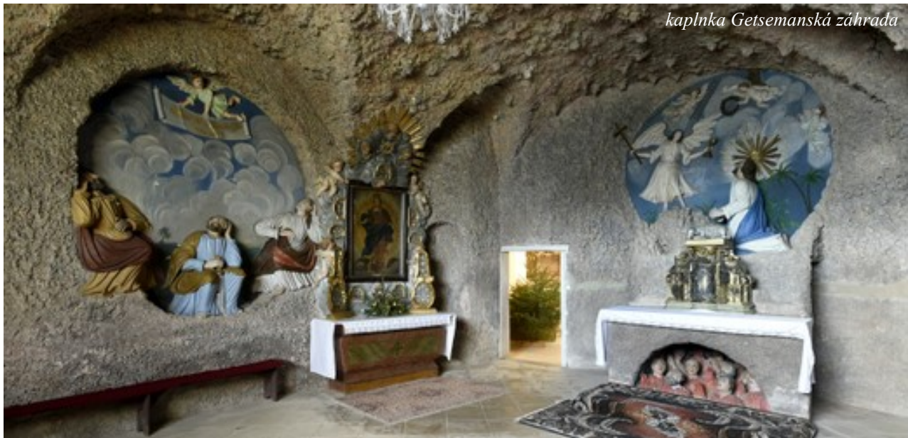
kaplnka Getsemanská záhrada