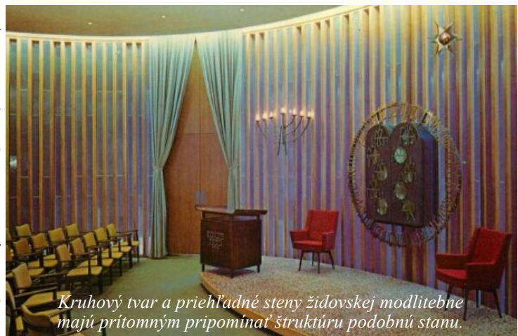
Kruhový tvar a priehľadné steny židovskej modlitebne majú prítomným pripomínať štruktúru podobnú stanu.