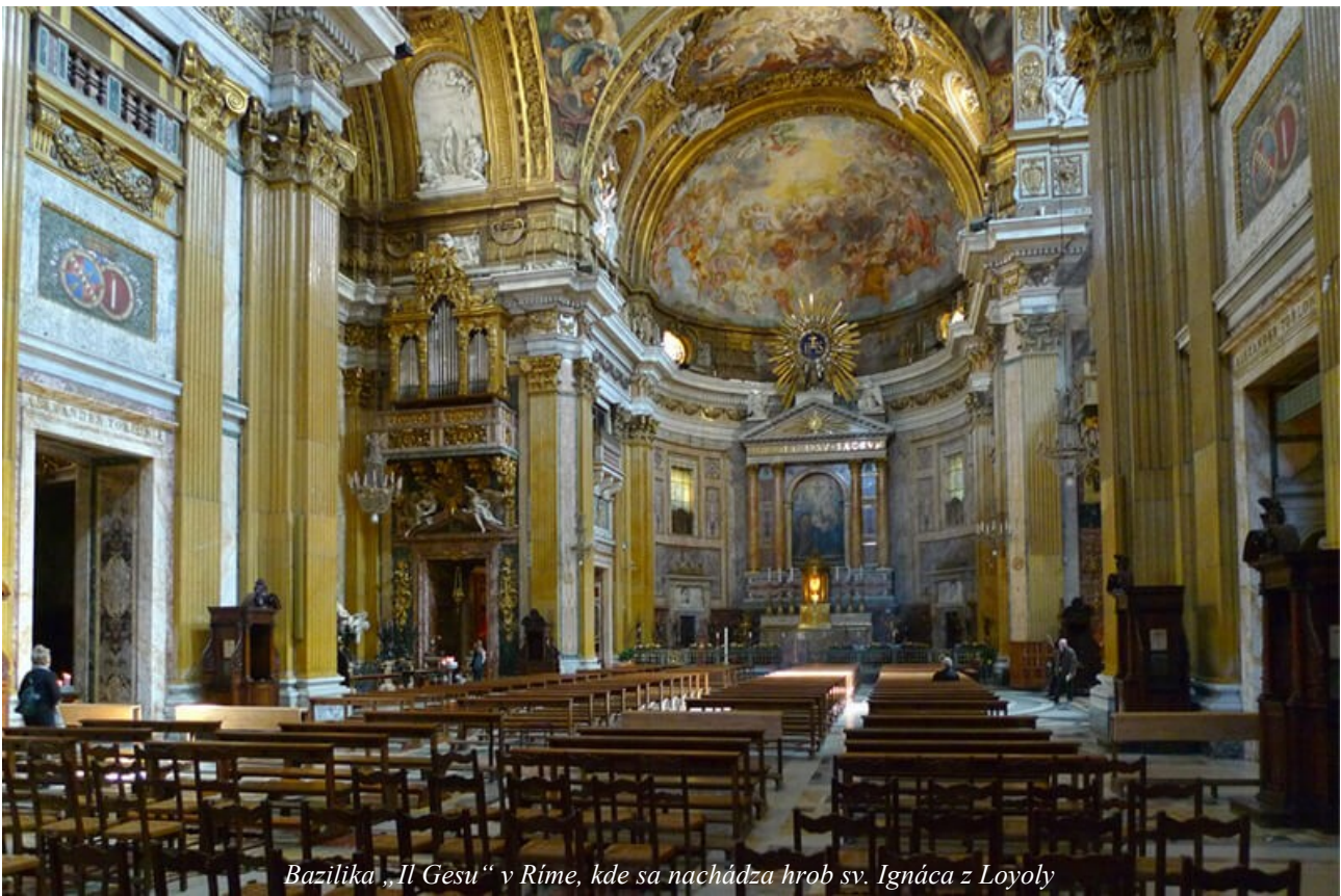
Bazilika „Il Gesù“ v Ríme, kde sa nachádza hrob sv. Ignáca z Loyoly

sv. Dionýza na parížskom Montmartre zložili doživotné sľuby čistoty, chudoby a misionárskeho pôsobenia vo Svätej zemi. Skupina sa po skončení univerzitných štúdií, rozšírená o ďalších troch spoločníkov, vybrala do Svätej zeme. Chceli tam apoštolsky pôsobiť a pomáhať kresťanským pútnikom. Zároveň urobili spoločnú dohodu o tom, že ak by sa cesta do Svätej zeme v priebehu jedného roku neuskutočnila, odoberú sa do Ríma, a ponúknu svoje služby pápežovi. Počas čakania na loď mladíci prijali kňazské svätenia a apoštolsky pôsobili v benátskom kraji. Celý rok nevyplávala z Benátok žiadna loď do Svätej zeme, a preto sa na jeseň v r. 1537 rozhodli odísť do Večného mesta. Ignác z Loyoly, Diego Lainez a Peter Fabre, prišli do Ríma už koncom októbra 1537. Ostatní strávili ešte zimu v okolí Benátok a do Ríma prišli na Veľkú noc 1538. Boli to: František Xaverský, Mikuláš Bobadilla, Šimon Rodriguez, Paschase Broet, Claude Jay, Alfonz Salmeron a Jean Codure. V r. 1538 sv. Ignác slúžil v rímskej bazilike Santa Maria Maggiore aj svoje primície. V meste sa skupinka mladých kňazov spoločne venovala apoštolátu a dobročinnosti. Keď ich prijal pápež Pavol III., ktorý vyjadril súhlas s ich činnosťou. Takto, pôsobením Božej Prozreteľnosti, vznikla rehoľná Spoločnosť Ježišova, ktorá výrazným spôsobom zasiahla do dejín Cirkvi. Jej členovia zložili okrem tradičných troch sľubov čistoty, chudoby