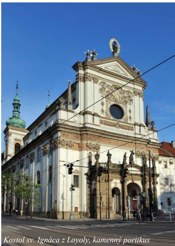
Kostol sv. Ignáca z Loyoly, kamenný portikus