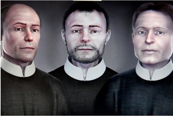
Pravdepodobný skutočný vzhľad tvári troch košických mučeníkov, podľa forenznej rekonštrukcie, ktorú vykonal Cicero Moraes, uznávaný brazílsky antropológ.