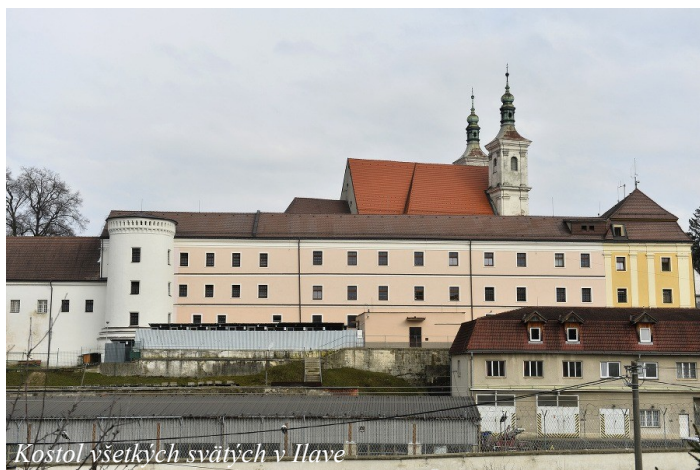
Kostol všetkých svätých v Ilave