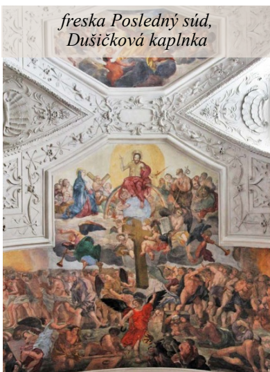
freska Posledný súd, Dušičková kaplnka

spoločenské akcie a prednášky. Z kaplnky vedie prístup na rokokovú kazateľnicu z umelého mramora, ktorá bola zhotovená v r. 1768. V kaplnke sv. Alojza Gonzagu je na svätostánku kópia talianskeho obrazu Panny Márie Dobrej rady (z talianskeho mesta Denazana). Oproti, v kaplnke Panny Márie Piekarskej , sa nachádza niekdajší pútnický oltár s obrazom Panny Márie Piekarskej, patrónky Horného Sliezska. Pôvodný obraz priviezli jezuiti do Prahy v období veľkého moru v r. 1680. Nevšedné patrocínium má kaplnka sv. Liboria . Nesie meno biskupa zo 4. st., ktorý bol vzývaný ako pomocník pri ochoreniach obličiek a žľáz. Kaplnka sv. Barbory je venovaná svätým pannám a prvým kresťanským mučeníckam. Podstatne väčšou kaplnkou ako ostatné je kaplnka Všetkých verných zomrelých (Dušičková kaplnka) . Zasahuje do budovy bývalého kolégia a bola dokončená v r. 1685. Na chóru je umiestnený barokový organ viedli sem pôvodne dve strany schodiska. Ľavá strana však bola