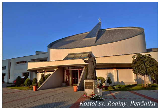
Kostol sv. Rodiny, Petržalka

zdroje: www.oratoriani.sk , www.zivotopisysvatych.sk , www.en.wikipedia.org , www.walksinrome.com , www.catholica.cz , www.svetkrestanstva.postoj.sk , www.santuariodivinoamore.it , www.it.wikipedia.org , www.blogspot.com , www.ilcenacolodeisiciliani.it , www.romasegreta.it