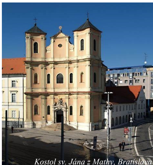
Kostol sv. Jána z Mathy, Bratislava