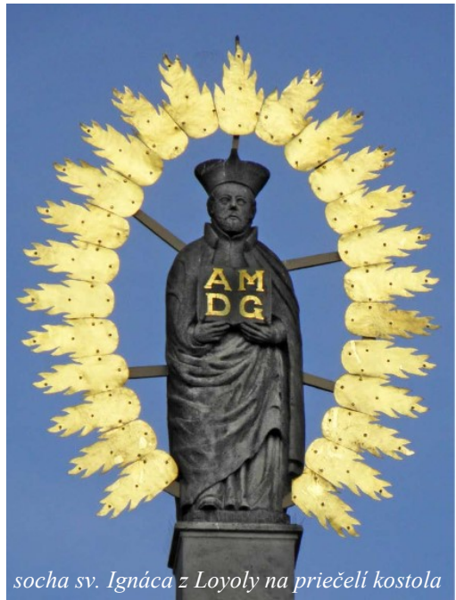
socha sv. Ignáca z Loyoly na priečeli kostola