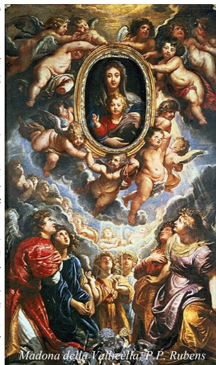
Madonna della Vallicella, P.P. Rubens