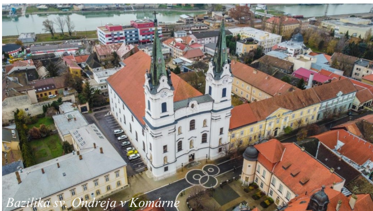
Bazilika sv. Ondreja v Komárne

stavebných plánov (do r. 1771). Chrám bol v r. 2018 povýšený na baziliku minor. V 18.st. sa jezuiti usadili v Liptovskom Mikuláši, Pezinku a v Rožňave, kde v r. 1755 zriadili gymnázium. Po zrušení jezuitskej rehole (pozn. proti zrušeniu rehole sa kategoricky postavili dvaja európski monarchovia, pruský kráľ Fridrich II. Veľký a ruská cárovna Katarína II. – jezuiti tam pôsobili aj v r. 1773-1814) sa skončila éra, v ktorej jezuiti boli nielen šíriteľmi viery, ale aj vzdelanosti