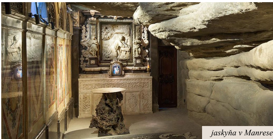
jaskyňa v Manrese