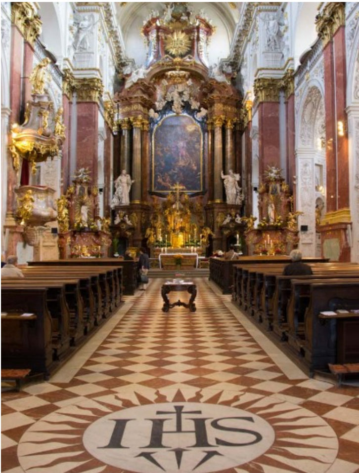
Vo vstupnej časti chrámu je na dlažbe (z r. 1686) je vložený veľký znak Spoločnosti Ježišovej.