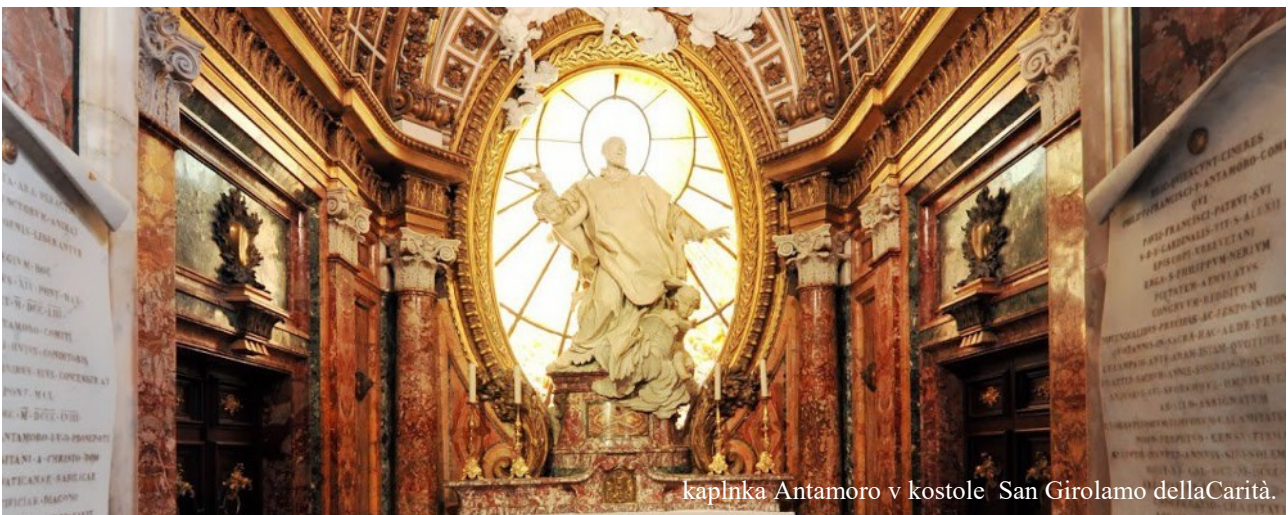
kaplnka Antamoro v kostole San Girolamo dellaCarità.