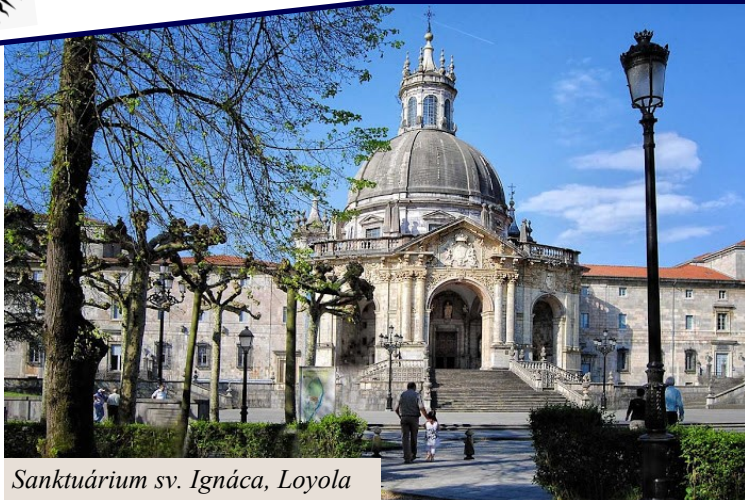
Sanktuárium sv. Ignáca, Loyola

Spoločnosť Ježišova (lat. Societas Jesu – skratka SJ ) je najväčší mužský katolícky rehoľný rád. V r. 1540 ho potvrdil pápež Pavol III. bulou Regimini militantis Ecclesiae . V súčasnosti pôsobí zhruba 15 000 jezuitov v 130 krajinách sveta. Majú viac ako 800 škôl a univerzít, pracujú v rôznych apoštolátoch: misie, veda, vzdelávanie, duchovné cvičenia, pomoc utečencom, ekumenizmus. Jezuitom je zverená pápežská hvezdáreň aj Radio Vaticana a CTV – „Centro televizivo vaticano. Veľa jezuitov pracuje v televízii, rádiu, filme a v tlači. Na čele rádu stojí