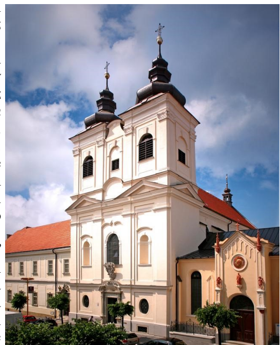
Kostol Najsvätejšej Trojice, Trnava V bočnom oltári sa nachádza hlavná časť relikvií troch košických mučeníkov