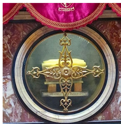
DETAIL: časť nájdených pozostatkov sv. Cyrila