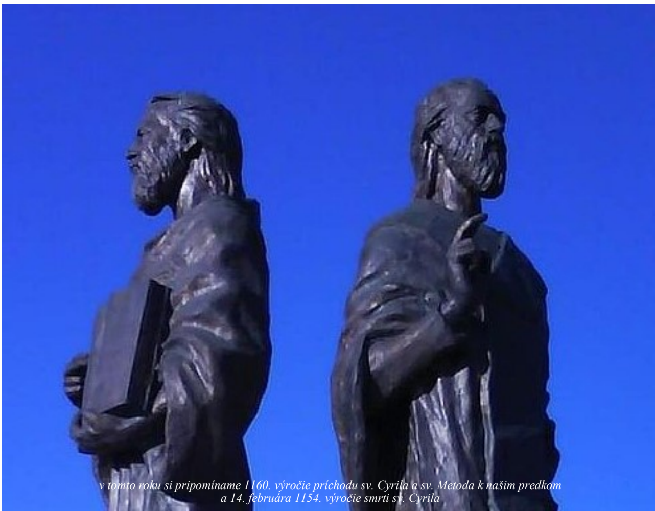
v tomto roku si pripomíname 1160. výročie príchodu sv. Cyrila a sv. Metoda k našim predkom a 14. februára 1154. výročie smrti sv. Cyrila