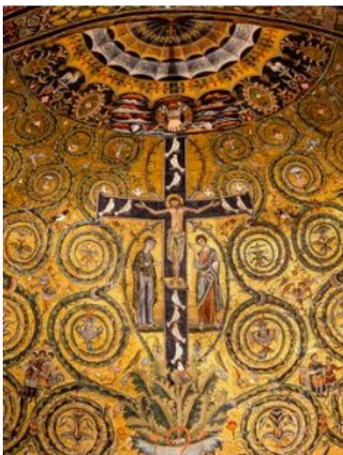
Takáto mozaika sa už nikde v Ríme nevyskytuje. Podobné možno nájsť iba v severotalianskom meste Ravenna.

V ľavej bočnej lodi je kaplnka Ružencovej Panny Márie a na protiláhlej strane vzadu gotická kaplnka sv. Kataríny Alexandrijskej s freskami od Masaccia a Masolina da Fiesolu z 15. st. Vpravo od vchodu je kaplnka sv. Jána Krstiteľa a za ňou kaplnka, ktorá bola až do r. 1715 zasvätená sv. Cyrilovi. Dnes je to kaplnka sv. Dominika. V strede pravej lode sa nachádza kaplnka sv. Cyrila a Metoda. Bola postavená v r. 1882 – 1886 pri príležitosti 1000 ročného výročia smrti sv. Metoda (885). Fresková výzdoba tohto priestoru je dielom maliara Salvatora Nobileho, predstavuje scény zo života sv. vierozvestov (obhajobu staroslovienciny ako bohoslužobnej reči, pohreb sv. Cyrila, evanjeliár s hlaholským písmom, pápeža Leva XIII. s modelom kaplnky a sv. Cyrilom a Metodom vedľa neho. V okrúhlym výklenku uprostred oltára je skrinka zo zeleného ónyxu, v ktorej je časť relikvií sv. Cyrila nájdená v r. 1963 a uložená sem pápežom Pavlom VI. Z pravej bočnej lode sa schádza do dolného kostola. V stenách popri schodoch sú vsadené rôzne archeologické nálezy z antických a ranokresťanských čias, ktoré boli nájdené pri vykopávkach. Popri stenách stoja väčšie