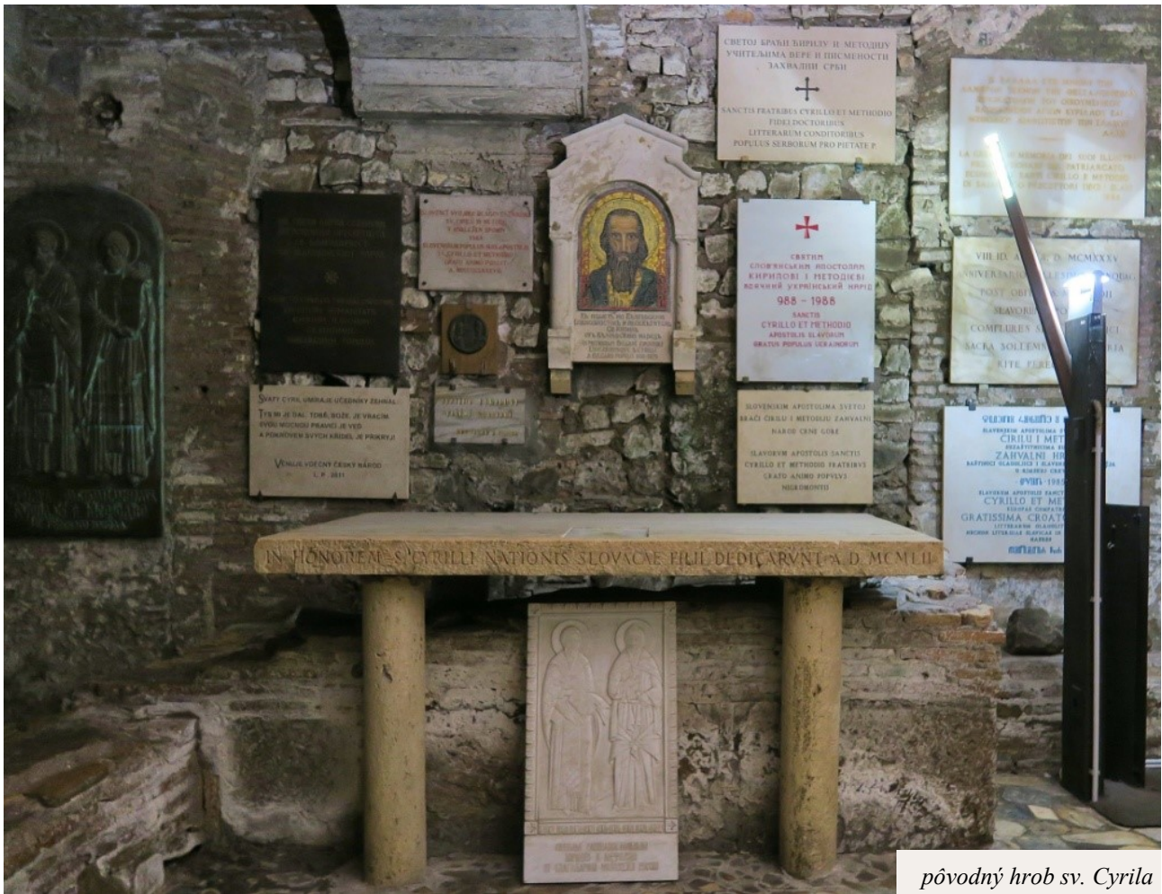
pôvodný hrob sv. Cyrila

Miesto zdobili kedysi maľby. Dodnes sa z nich zachovalo iba malé torzo. Nad miestom, kde sa nachádzal otvor s pôvodným hrobom je dnes jednoduchý oltár, dar amerických Slovákov z r. 1952, a okolo neho pamätné tabule viacerých slovanských národov. V blízkosti je i veľká mozaika oboch solúnskych bratov, pochádzajúca z Bulharska. Najnovšia tabuľa zo Slovenska pribudla na tomto mieste v januári tohto roku. Je z hnedastého prírodného kameňa a bola požehnaná pápežom Františkom 15. júna 2022 k 60. výročiu slovenského oltára. Slávnostne bola odhalená v januári 2023 k 30. výročiu Slovenskej republiky. Na tabuli je slovenský znak a nápis: Pamiatke slovanských apoštolov svätých Konštantína – Cyrila a svätého Metoda, spolupatrónov Slovenska a Európy. Neďaleko miesta pôvodného hrobu sa schádza do najnižšieho poschodia, kde