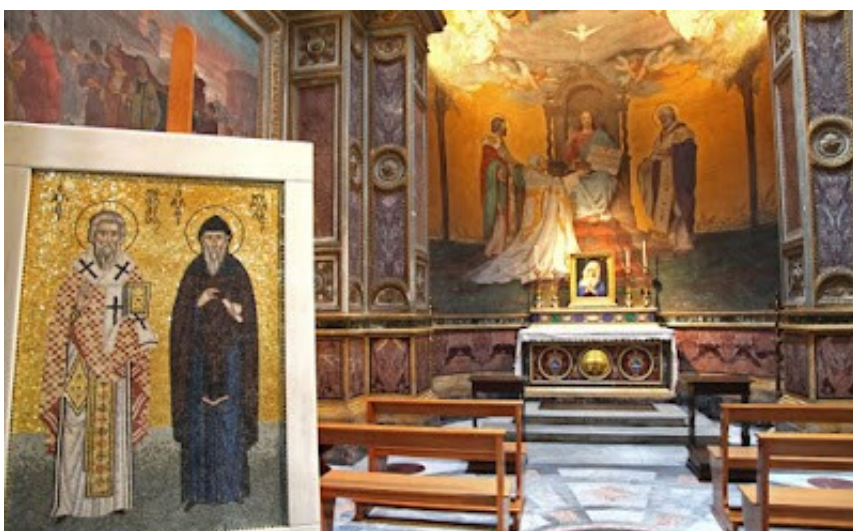
Kaplnka sv. Dominika s relikviami sv. Cyrila