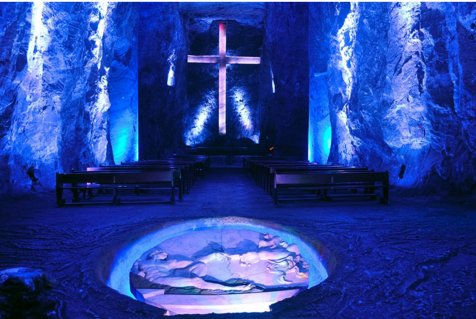
Catedral del Sal